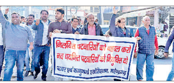
नारनौल। महावीर चौक पर विरोध प्रदर्शन करते एसोसिएशन सदस्य।

पर फसल खराबा वेरिफिकेशन में निलंबित किया गया है। कारण, उन्होंने एक ही फोटो कई बार