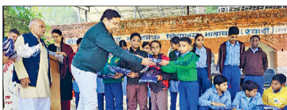
रेवाड़ी। स्कूल में बच्चों को स्टेटर वितरित करते हुए।

पुलिस ने जुआ-सट्टा, नशा तस्करी व अवैध रूप से शराब बेचने वालों को गिरफ्तार करने में सफलता हासिल की। कोसली थाना पुलिस ने जुआ खेलते हुए चार आरोपी संजय निवासी गांव टिहकारी जिला कटनी एमपी हाल