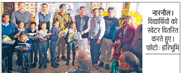
नारनौल। विद्यार्थियों को स्वेटर वितरित करते हुए।

अग्रवाल वैश्य समाज जिला इकाई की ओर से स्थापना दिवस पर सोमवार को सामाजिक एवं मानवसेवा कार्यक्रम का आयोजन किया गया। कार्यक्रम के अंतर्गत जरूरतमंद व आर्थिक रूप से कमजोर वर्ग के विद्यार्थियों व परिवारों को निःशुल्क स्वेटर, जूते, जुराब व खाद्य सामग्री वितरित की गई। कार्यक्रम का आयोजन राजकीय