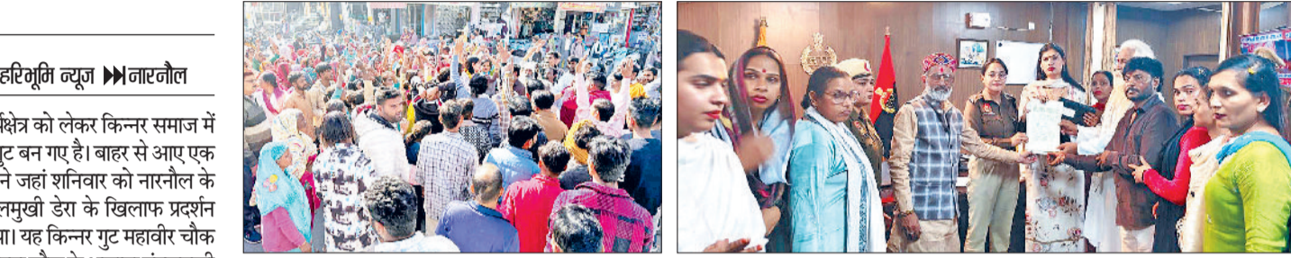
नारनौल। महावीर चौक पर एकत्रित मंगलमुखी डेरे के पक्ष में लोग व एसपी को मांग पत्र सौंपते हुए।