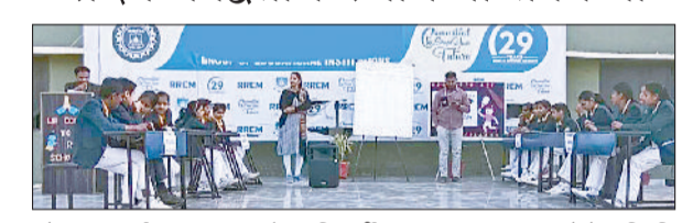
महेंद्रगढ़। कार्यक्रम प्रस्तुत करते हुए विद्यार्थी।

महेंद्रगढ़। सरस्वती शिक्षा निकेतन वरिष्ठ माध्यमिक विद्यालय माजरा कला में अंतर सदन सामान्य ज्ञान प्रतियोगिता का आयोजन किया गया। जिसमें चारों सदन भगतसिंह, राजगुरु, सुखदेव व चन्द्रशेखर आजाद की टीमों ने भाग लिया। इस प्रतियोगिता में खेल जगत, फिल्म, राजनीति व सामान्य ज्ञान से सम्बंधित प्रश्न पूछे गए। प्रधानाचार्य ने इस प्रतियोगिता के परिणाम जारी