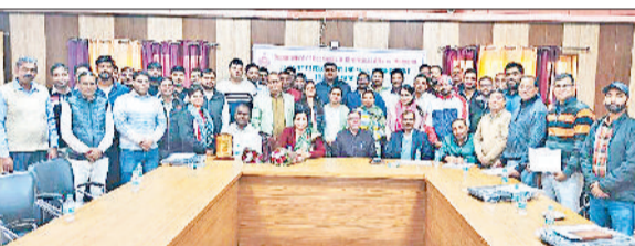
नारनौल। प्रशिक्षण कार्यक्रम में मौजूद कर्मचारी व आयोजक।