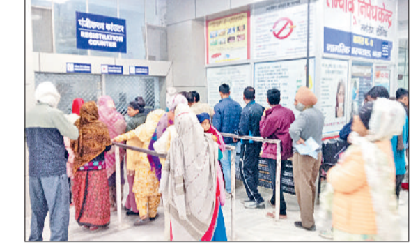
नारनौल। नागरिक अस्पताल के काउंटर पर रजिस्ट्रेशन कराते मरीज। एक्स-रे रूम के बाहर खड़े मरीज।

एसएमओ की सीधी भर्ती के विरोध में हरियाणा सिविल मेडिकल सर्विसेज एसोसिएशन के आह्वान पर बुलाई गई हड़ताल का पहले दिन कोई खास असर दिखाई नहीं दिया। इन डाक्टरों ने मास लिब यानि सामूहिक अवकाश लेकर स्ट्राइक का ऐलान किया हुआ था और सरकारी डाक्टर ड्यूटी से नदारद दिखाई दिए। स्वास्थ्य विभाग के अनुसार नागरिक अस्पताल के 16 डाक्टर गैर-हाजिर रहे। हालांकि इस हड़ताल से निपटने की स्वास्थ्य विभाग नारनौल ने पहले से ही तैयार कर ली थी और वैकल्पिक तौर पर कोरियावास मेडिकल कॉलेज के डाक्टरों को ड्यूटी पर बुला लिया। एनएचएम एवं आयुर्वेद के चिकित्सक भी ड्यूटी पर हाजिर रहे, जिस कारण सभी सेवाएं आमदिनों की भांति सुचारु रूप से चली।