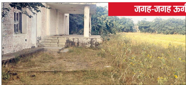
रेवाड़ी। खेल स्टेडियम के भवन तक ऊगी खरपतवार तथा स्टेडियम में फैली कंटली झाड़ियां।